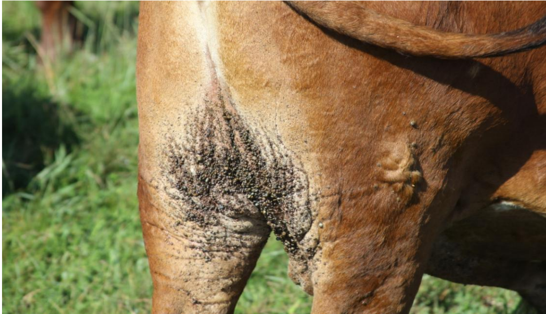
Fig 1 Erge Bloubosluis Besmetting

Strategiese bosluisbeheer verwys na bloubosluisbeheer op plase waar daar geweldige probleme is met hoë bosluisladings in die laat somer en herfs. Dit is belangrik om te onthou dat die normale multigasheer bosluisbeheer (dip/sproei of opgietmiddels) moet inskakel en saam met die strategiese bloubosluisbeheer geskied.